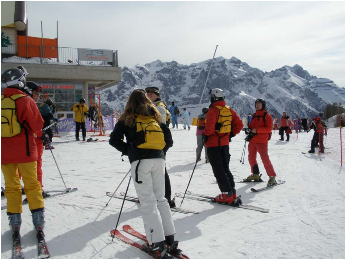
Så er vi i Folgarida – et anderledes, og meget smukt sted. Igen var vi heldige – dejligt vejr, masser af sne og sol, og som altid dejligt selskab.