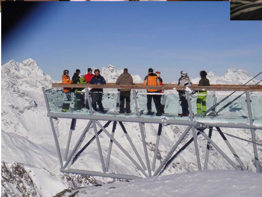
Skiposten nr. 1, maj 2010