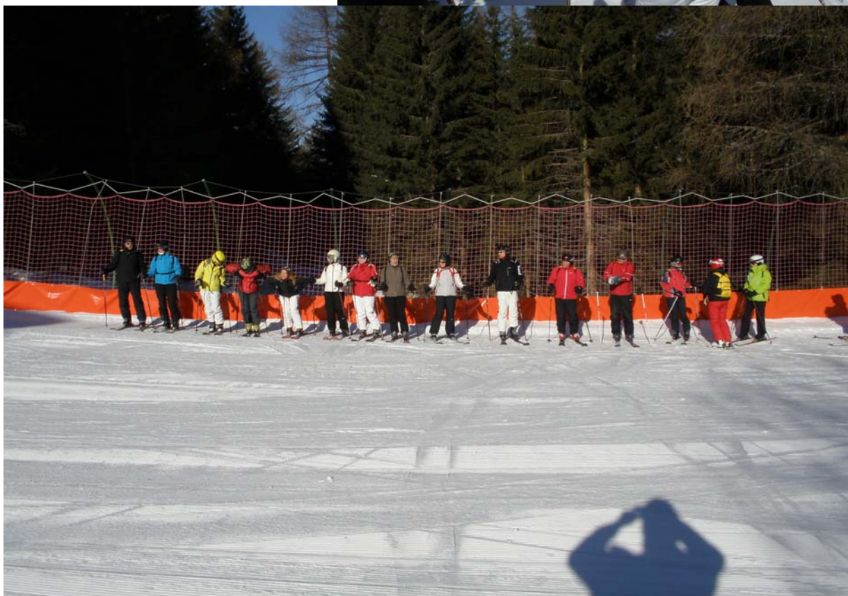
Skiposten nr. 1, maj 2010